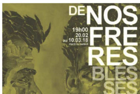
De nos frères blessés, Mise en scène de Fabrice Henry, Les Déchargeurs

De nos frères blessés, une adaptation directe et sans concessions du sort d'un condamné à mort pendant la guerre d'Algérie